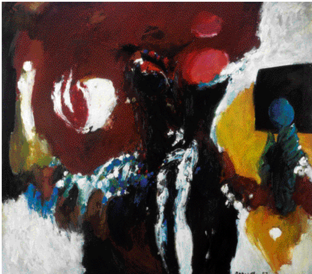
PROSTOR STOLETÍ, 1987, OLEJ, 110 x 130 cm

Obrazy, grafika a kresby vytvářejí pozoruhodné, harmonicky vyrovnané a svěbytné dílo, které vyzrálo v celek vyjadřující malířův pocit vnímání světa.