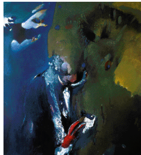
ZMIZELÝ PORTRÉT, 1988, OLEJ, 140 x 130 cm