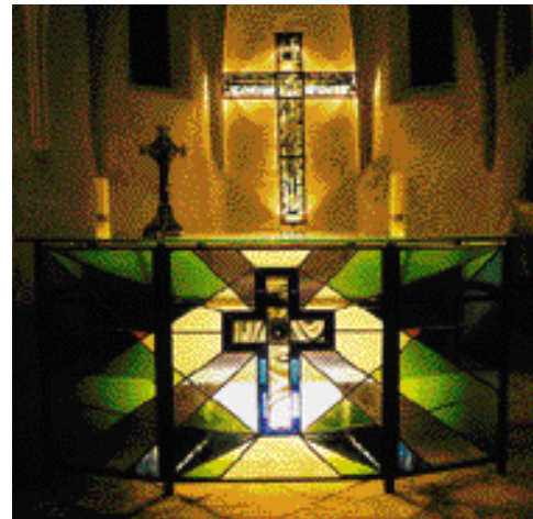
VITRÁŽOVÝ KŘÍŽ A OLTÁŘ, 1999, výška 3,5 m

Svými nespoutanými vizemi výtvarník a zároveň pedagog zasahuje i své žáky – gymnazisty tak,