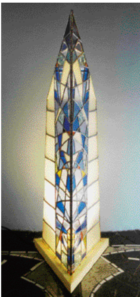
VITRÁŽOVÁ VĚŽ, SKLO, OLOVO, výška 140 cm