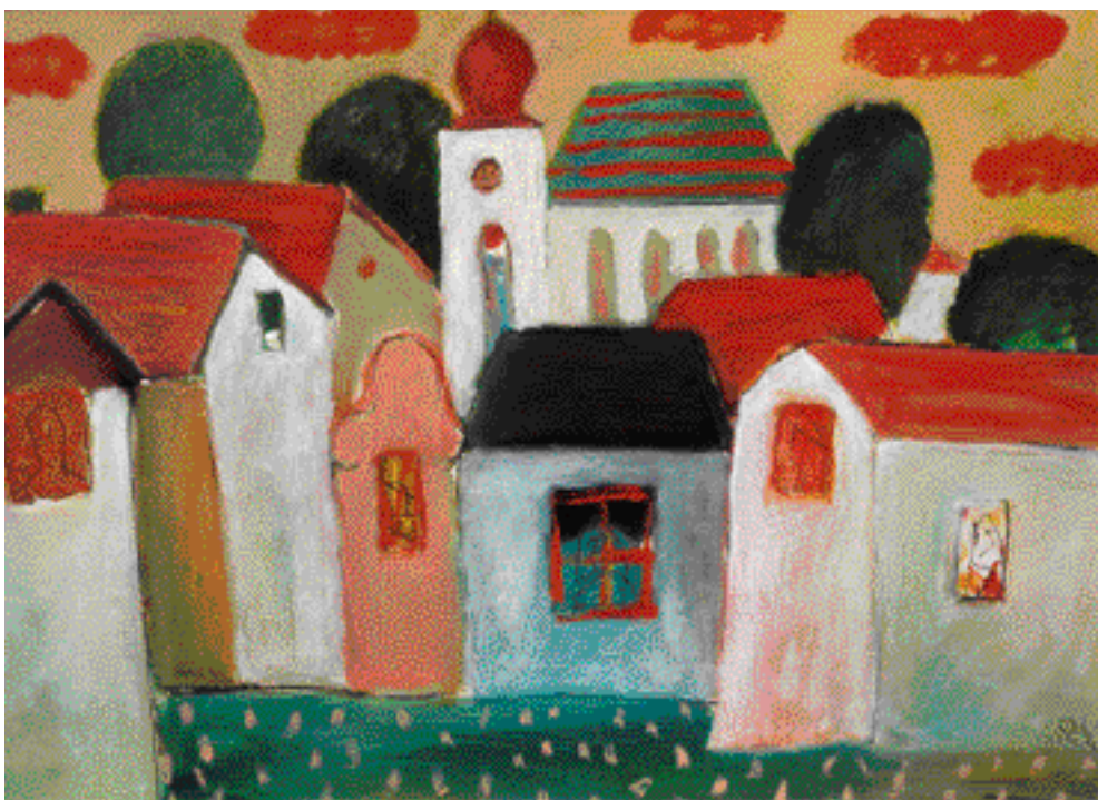
JIHOČESKÁ VESNICE, 1993, OLEJ, 50 x 72 cm