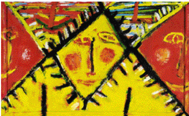
SLUNCE VYCHÁZÍ, 1995, OLEJ, 38 x 62 cm